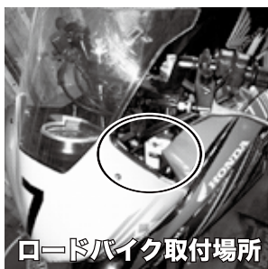
ロードバイク取付場所

左図の通り取り付けてください。 ハンドルを左右いっぱい切ったときに、ハンドルの切れ角を阻害せず、転倒時などに計測器を破損しないように各自工夫して取り付けてください。スクーターの方は各自工夫してください。 ★決勝後は速やかに返却してください！ホルダーも忘れずに！