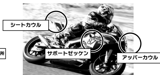
サポートゼッケンの例